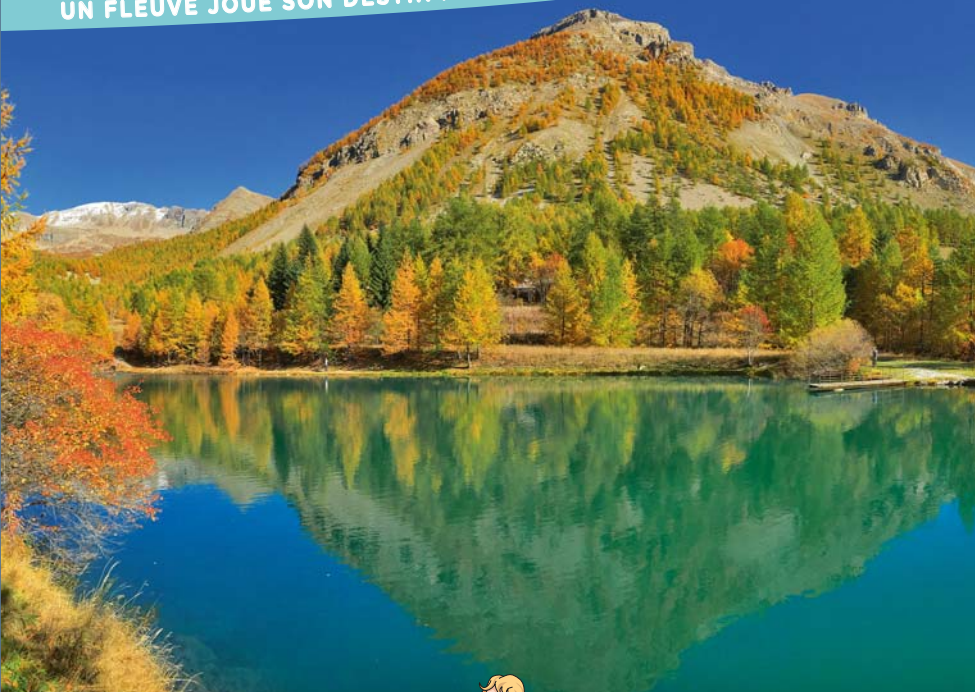
Le lac d'Estenc.

En amont du val d'Entraunes, vers le col de la Cayolle et le vallon de Sanguinière, les paysages découvrent leur modelé glaciaire : vallées en auge, cirques, dépôts morainiques et blocs erratiques apportés par le glacier. Le jardin alpin d'Estenc propose un sentier d'interprétation de la flore et de la faune de ces milieux particuliers. Vous pourrez ainsi admirer des espèces comme la cardamine à feuilles de réséda ou l'œillet rouge à pétales poilus. Dans le beau mélèzein, peut-être aurez-vous la chance d'apercevoir la chouette de Tengmalm qui